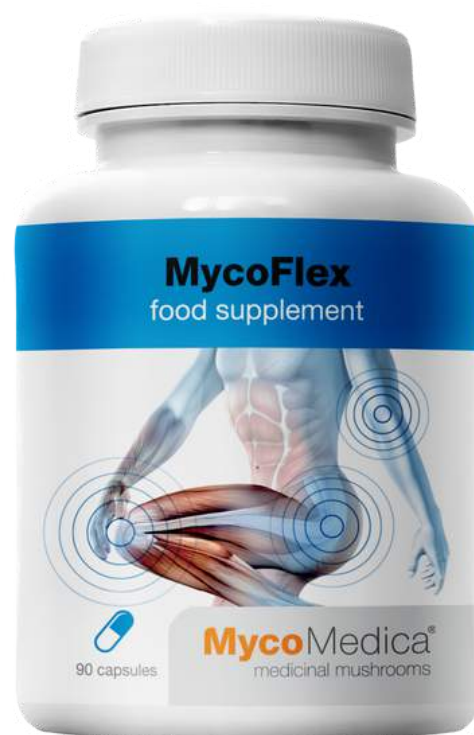
MycoFlex SUPLEMENT DIETY

Dla osób uprawiających sport , po kontuzjach i w trakcie rehabilitacji po urazach. Pomaga wzmocnić kolana i stawy łagodząc dolegliwości bólowe. Zawiera Cordyceps.