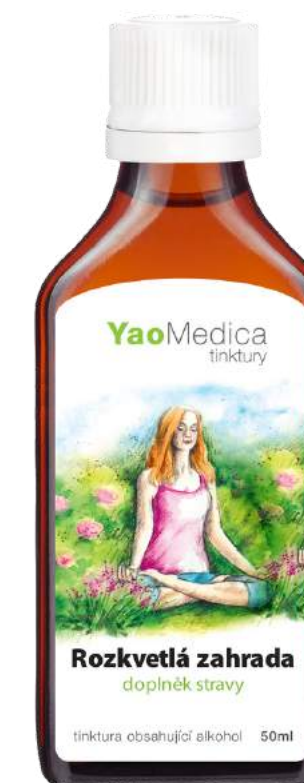
107 Kwitnący ogród KUN BAO TANG

Wpływa pozytywnie na psychikę, uspokaja, pomaga przy bezsenności i w stanach lękowych. Zalecany na drażliwość, depresję i stres.