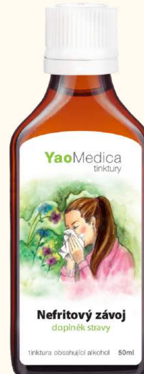
041 Nefrytowy welon TE XIAO BI MIN GAN WAN

Zawarte w recepturze zioła pomagają regulować układ odpornościowy i stosowane są przy alergiach sezonowych i przewlekłym nieżycie nosa.