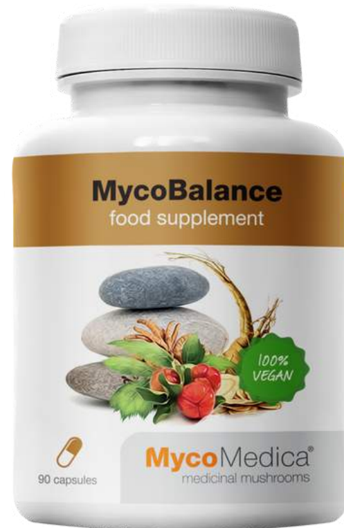
MycoBalance SUPLEMENT DIETY

Wspiera witalność, siłę życiową i odporność zarówno fizyczną jak i psychiczną . Zawiera Reishi, Cordyceps, Shiitake, korzeń dzięgla i żeń-szenia.