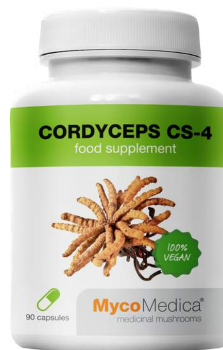
Cordyceps SUPLEMENT DIETY

Dla osób uprawiających sport , po kontuzjach i w trakcie rehabilitacji po urazach. Pomaga wzmocnić kolana i stawy łagodząc dolegliwości bólowe. Zawiera Cordyceps.