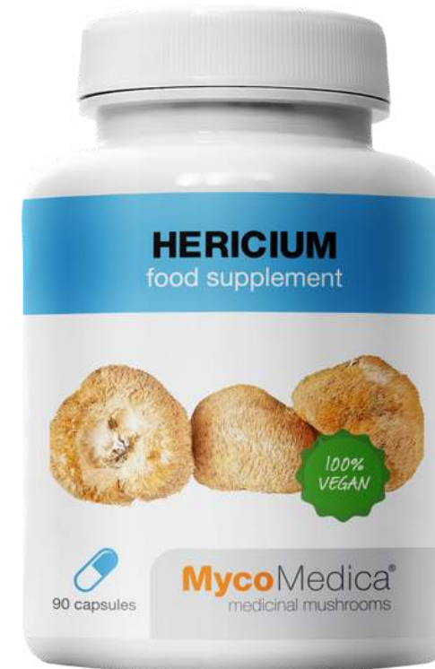
Hericium SUPLEMENT DIETY

Wspiera witalność, siłę życiową i odporność zarówno fizyczną jak i psychiczną . Zawiera Reishi, Cordyceps, Shiitake, korzeń dzięgla i żeń-szenia.