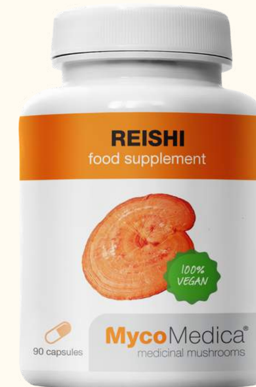
Reishi SUPLEMENT DIETY

Zawarte w recepturze zioła pomagają na wodnisty katar w wyniku reakcji alergicznej, zatkany nos, kichanie, swędzenie i pieczenie oczu.