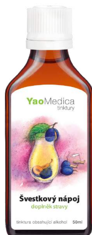
105 Napój śliwkowy WU MEI WAN

Zawarte w recepturze zioła wspierają w pozbyciu się pasożytów jelitowych , robaków a także biegunek bakteryjnych.