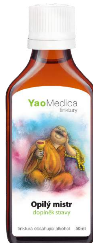
007 Pijany mistrz GE HUA JIE CHENG TANG

Zawarte w recepturze zioła wspierają w pozbyciu się pasożytów jelitowych , robaków a także biegunek bakteryjnych.