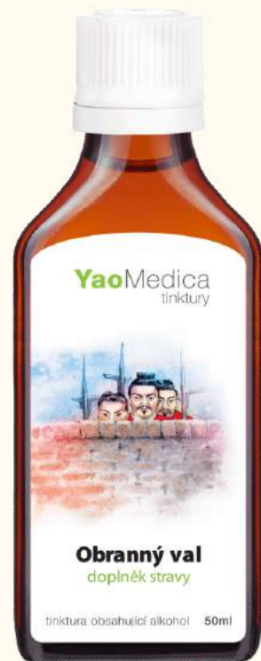
095 Mur obronny YU PING FENG SAN

Zawarte w recepturze zioła pomagają regulować układ odpornościowy i stosowane są przy alergiach sezonowych i przewlekłym nieżycie nosa.