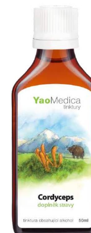
026 Cordyceps MACZUŹNIK CHIŃSKI

Jeden z najmocniejszych grzybów podnoszących poziom energii . Wzmacnia odporność i cały organizm oraz zwiększa wydolność Płuc.