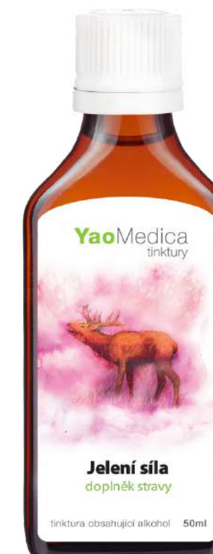
034 Siła jelenia YOU GUI WAN JIA JIAN

Zawarte w recepturze zioła wspierają w oczyszczaniu organizmu po spożyciu alkoholu i łagodzą skutki zatrucia nim.